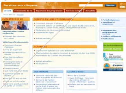
Page 2 pour les détails